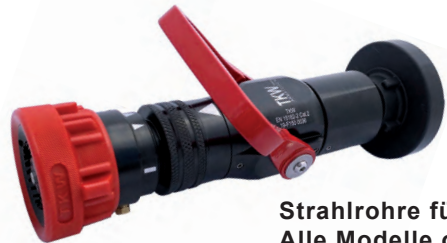
Strahlrohre für den Innenangriff Alle Modelle ohne Griff lieferbar

Hohlstrahlrohr TKW FF 400 Durchfluss: 400 l/min bei 6 bar